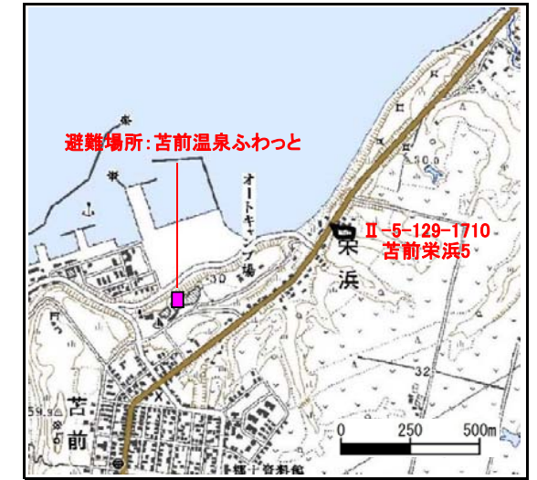
位置図 (図の上位が北を示す)