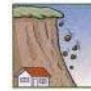
がけから小石がぱらぱらと落ちてくる。