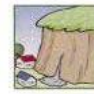
がけから水が湧き出ている。