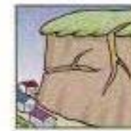
がけに割れ目が見える。

次のような現象を察知した場合は、土砂災害が直後に起こる可能性があります。直ちに周りの人と安全な場所へ避難するとともに、関係機関へ通報して下さい。