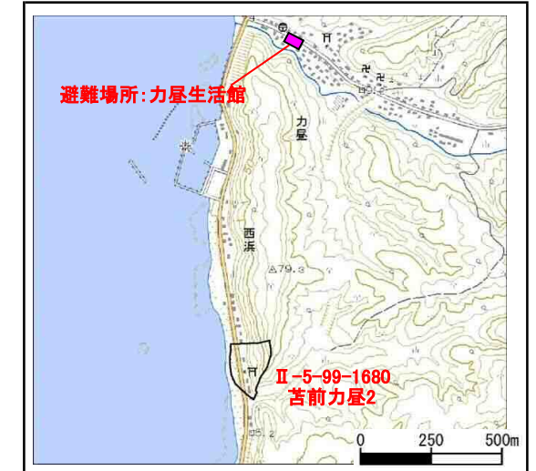
位置図 (図の上位が北を示す)