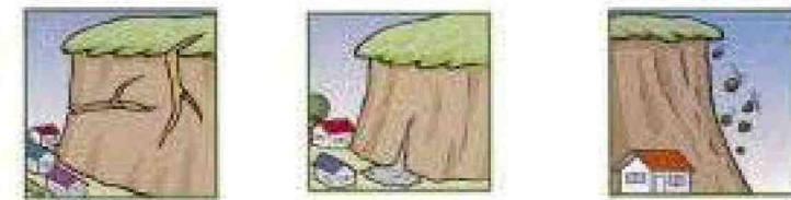
がけに割れ目が見える。

次のような現象を察知した場合は、土砂災害が直後に起こる可能性があります。直ちに周りの人と安全な場所へ避難するとともに、関係機関へ通報して下さい。