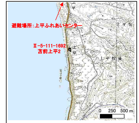
位置図 (図の上位が北を示す)