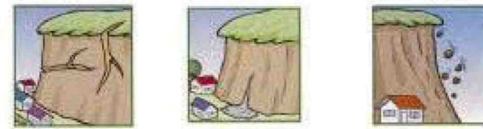
がけに割れ目が見える。

次のような現象を察知した場合は、土砂災害が直後に起こる可能性があります。直ちに周りの人と安全な場所へ避難するとともに、関係機関へ通報して下さい。