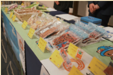
懐かしい味から新しい味までとりそろえた物販コーナー