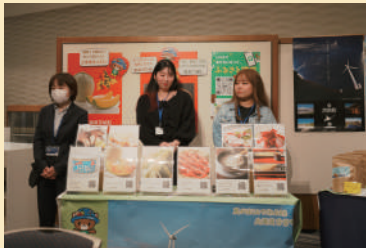
ふるさと納税のブースも作り、学生ボランティアとともにPR