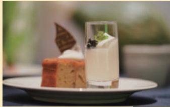
苫前のお米のゆめぴりかで作った甘酒「あまびりか」を使用したスイーツ