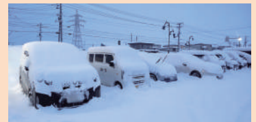
雪で埋まる職員の車

こんにちは! 北海道苫前町です! 3月になりました。12月半ばくらいまで今年 は雪が少ないかもと思っていましたが、やはり そういうことにはならず・・・どかどかと雪が 降り積もり、猛吹雪でホワイトアウトしたりと いつも以上の苫前の冬が到来しました。大人た ちは雪かきにうんざりしていましたが、子ども たちはスキーや雪遊びにと嬉しい冬を楽しく 過ごしていました。