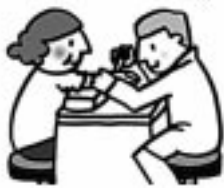
早かに受ける 肝炎ウイルス検査

そのためにもぜひ受けてほしいのが肝炎ウイルス検査です。苦前町では、特定健康診査と一緒に受けることができます。次回の特健康診査は来年一月に実施されますので、回覧等でご確認下さい。