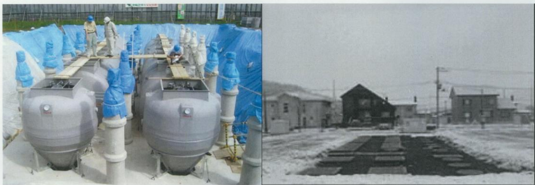
写真1 接触酸化型（北海道苫前町）