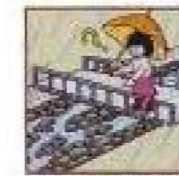
雨が降り続けているのに川の水位が下がる。