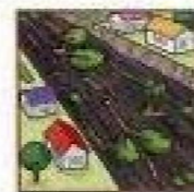
急に川の流れるが濁り、流木が混ざり始める。

次のような現象を察知した場合は、土砂災害が直後に起こる可能性があります。直ちに周りの人と安全な場所へ避難するとともに、関係機関へ通報して下さい。