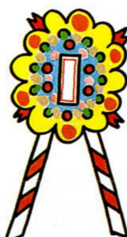
落成式・開店祝の花輪