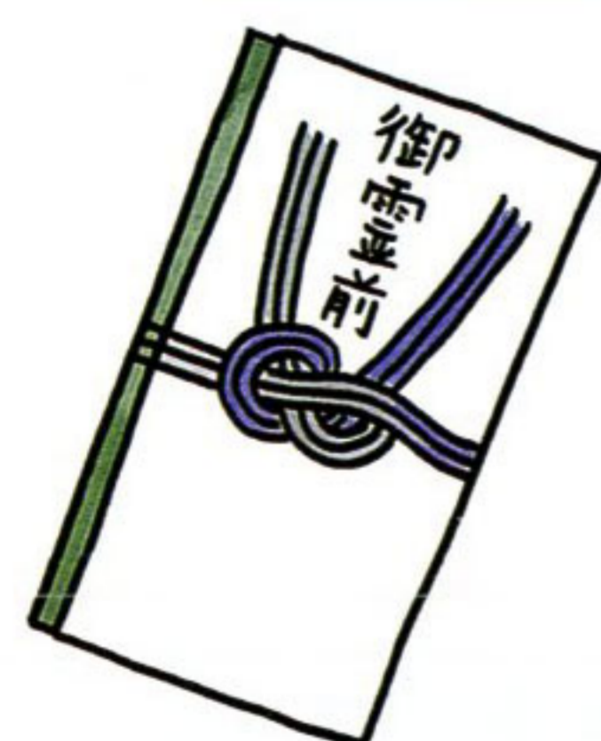
秘書等が代理で出席する 場合の葬式の香典