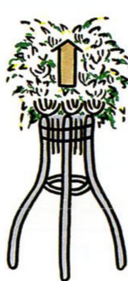
葬式の花輪・供花