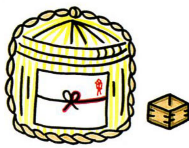
お祭りへの寄附や差入