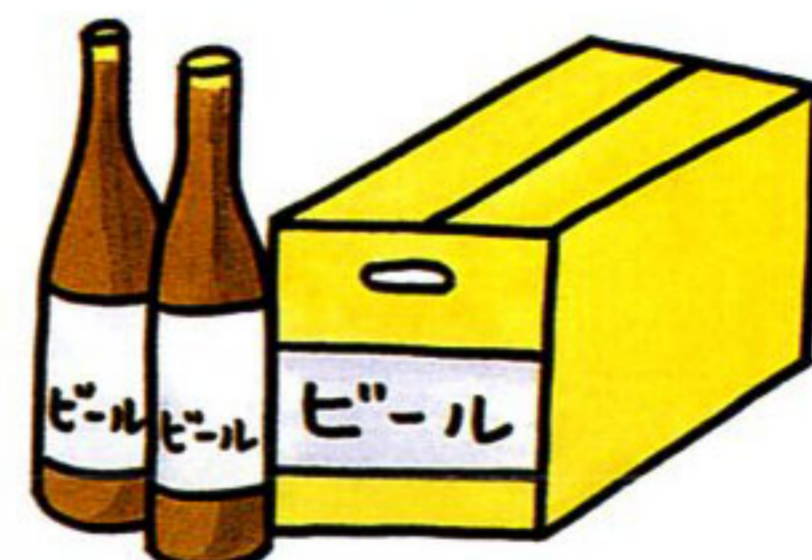
町内会の集会や旅行などの 催物への寸志や飲食物の差入