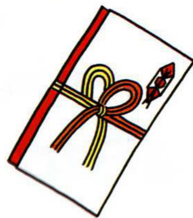
秘書等が代理で出席する 場合の結婚祝