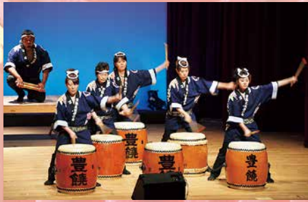
苫前町豊饒太鼓保存会