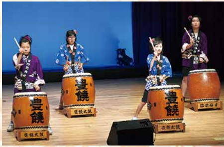
豊饒太鼓ジュニア