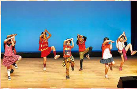
古丹別小学校3年生