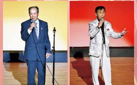
古丹別カラオケ愛好会