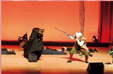
苫前町くま獅子保存会