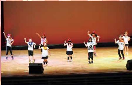
古丹別小学校1年生