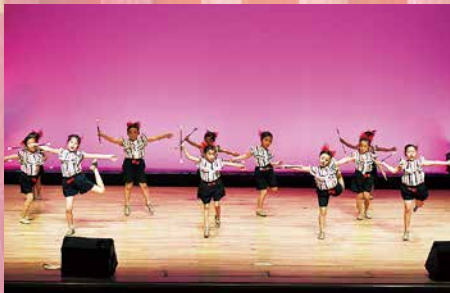
PL MBA 羽幌教室