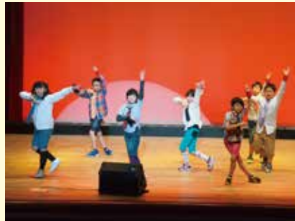
古丹別小学校3年生