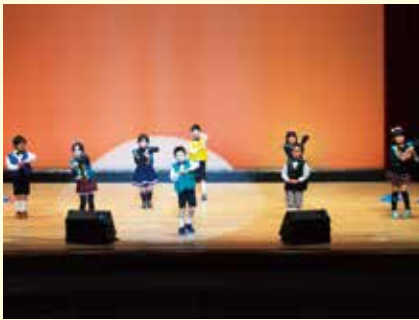
古丹別小学校1年生