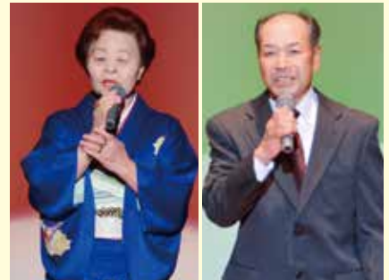
古丹別カラオケ愛好会