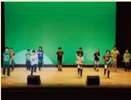
古丹別小学校5年生