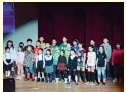
こどもピアノサークル&苫前まちづくり企画