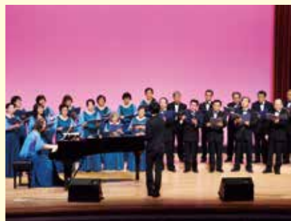
クリスタルコーラス