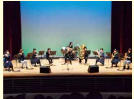
苫前中学校吹奏楽部