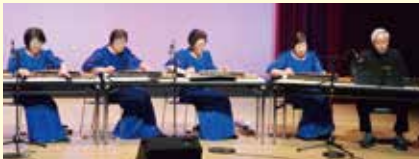
大正琴苫前町同好会