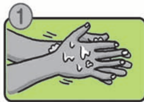
流水でよく手をぬらした後、石けんをつき、手のひらをよくこすります。

手の平側よりも手の甲側、特に指先は洗い残しが多い部分です。さらに利き手側にも洗い残しは多くなるので、手洗いの際は利き手も人念に洗うよう心がけましょう。洗い残しをなくすためには30秒ほど時間をかけてしっかりと洗い、洗い終わった後は清潔なタオル又は使い捨てのペーパータオルで拭くことが大切です。