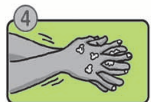
指の間を洗います。