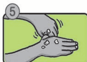
親指と手のひらをねじり洗います。