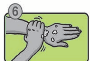
手首も忘れずに洗います。