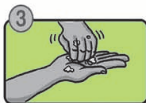
指先・爪の間を念入りにこすります。