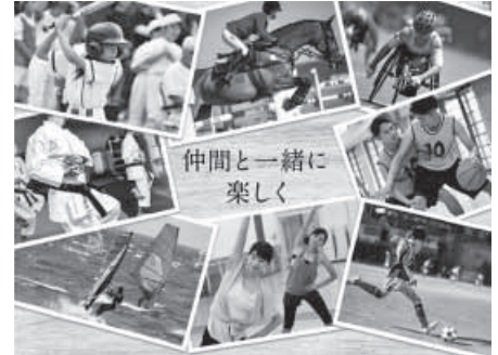
小さな掛金、大きな補償