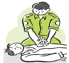
【出動件数115件・搬送人員107人】

平成30年の町内救急出動件数は115件。前年と比較すると4件減少。また、医療機関への搬送人員は107人、7名の減少となりました。搬送した年齢別の内訳は、65歳以上の高齢者が86人で全体の約80%を占めています。また、搬送医療機関は道立羽幌病院が最も多く、全体の約93%を占めますが、病状により留萌市立への搬送や、緊急度の高い場合はDrへり搬送をする場合もあります。