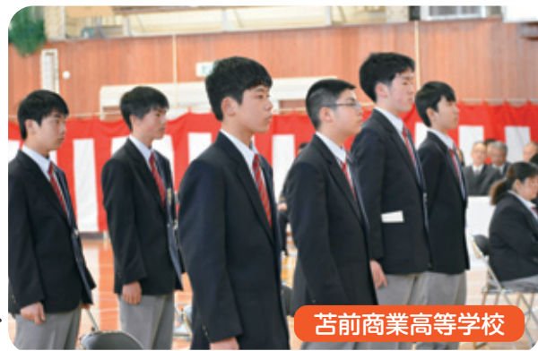
苫前商業高等学校

4月は入学シーズンでした。新しい制服で初めての学校、新たな友だち、新たな職場環境など、とかくバタバタして気づけば5月のゴールデンウィークを迎えます。 特に高校を卒業して地元を離れた仲間達は、ひとまずゴールデンデンウィークには帰って来て近況報告をします。 でも8月のお盆になるとどうでしょう。半分は帰ってくるかどうか…。住めば都、新たな友だちが出来て居心地がいいのかもしれないが、せめてお盆やお正月には仲間達と顔を合わせたいですね。 (P)