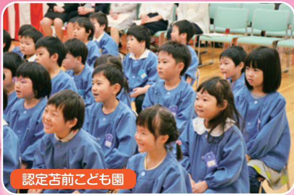
認定苫前こども園