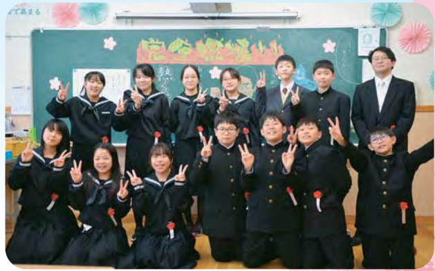
✳️ 古丹別小学校 ✳️