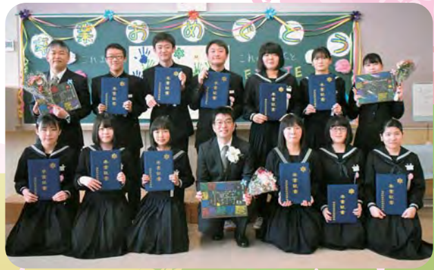
✳️ 古丹別中学校 ✳️