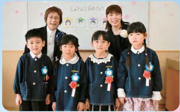
✳️ 古丹別保育所 ✳️