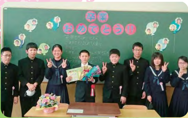
✳️ 苫前中学校 ✳️