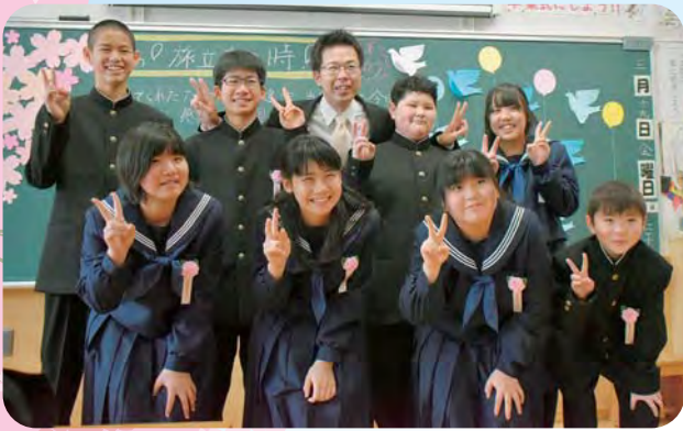
✳️ 苫前小学校 ✳️