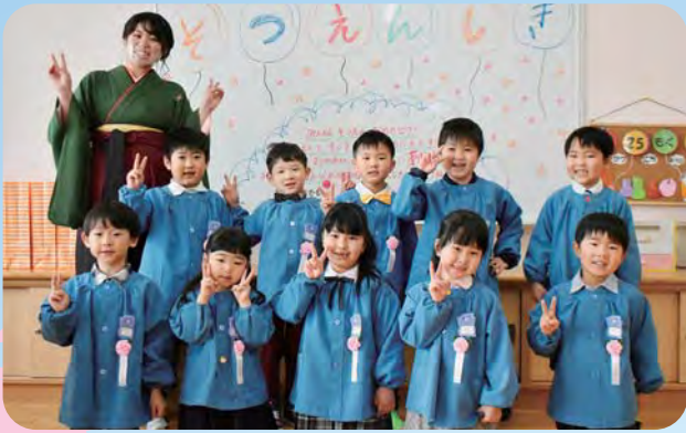
✳️ 認定苫前こども園 ✳️