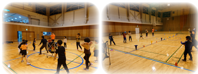
バルシューレ体験会