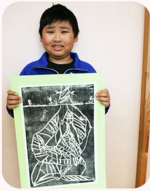
みつき 朝桐 照貴 4年 「木の根の回路」 木の根が、まるで回路のようにつながっている様子を版画で表しました。地上に花やきのこを入れるなど工夫しました。