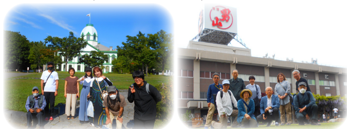
公民館講座（大人の見学旅行）