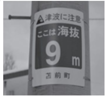
力昼市街に設置した海拔表示板

災害はいつ起こるかかわからないので、地域住民の方々がこの表示板を見ることで防災意識の向上につながることを期待しています。