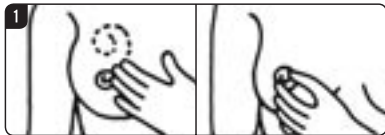
1 反対の手の指で、乳房と脇の下にしこりがないか、乳首をつまんで分泌物がないかどうかチェック！

がん細胞は毎日できますが、免疫細胞が殺すもの、とりこぼしてしまうものがあります。乳がんの場合、がん細胞が15年かかって1cmの塊になるといわれます。しかし、1cmのがん細胞の塊が2cmになる時間は、たった1年です。そこで大切なのが月1回のセルフチェックと、2年に1回のマンモグラフィ検査です。図を参考に試してみましよう。