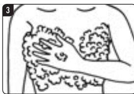
3 お風呂では、スポンジやタオルを使わず、泡立てた石けんなどをつけて、手と指でチェック！