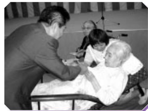
森町長より対象者へ祝い金が手渡される

には、歌に併せて踊りだす高齢者の姿に、今年も元気でいることを確かめ合つ高齢者もあり、午後一時三十分、ときを惜しみながらも赤ら顔で再会を誓い合いながら閉会となった。