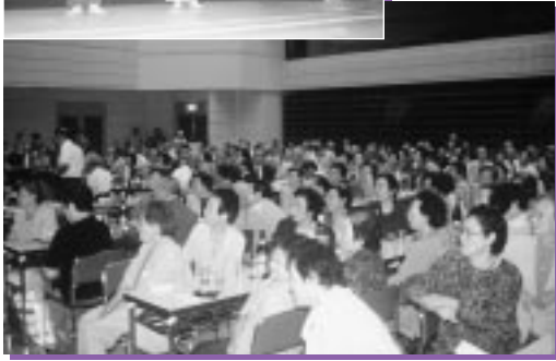
古丹別保育所園児のお遊戯を楽しむお年寄り