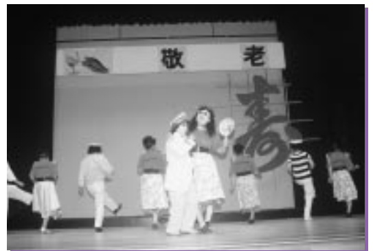
苫前婦人会によるカラオケ&ダンス「港町十三番地」

ちよ歌謡ショー」では、小気味のいい歌声に酔いしれ、握手をしながら会場を回る姿に大きな拍手が会場に響き渡り、さらに保育所園児や婦人会の舞踊・ダンスが披露され、拍手が鳴り止まなかった。中