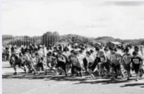
3Kmコースに参加する参加者（小学5・6年男子と中学生女子の部）