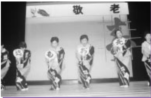
古丹別婦人会による舞踊「いつ迄もお元気で」 (曲「俺の苫前」)

には、歌に併せて踊りだす高齢者の姿に、今年も元気でいることを確かめ合つ高齢者もあり、午後一時三十分、ときを惜しみながらも赤ら顔で再会を誓い合いながら閉会となった。