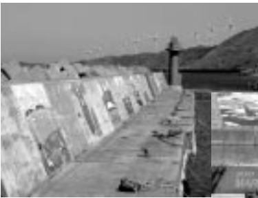
13枚の壁画がそろう力昼漁港