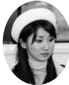
キャンペーンガール

11月14日、平成18年留萌管内米PRキャラバン隊が、苫前消費者協会を訪問し、消費拡大のPRを行った。