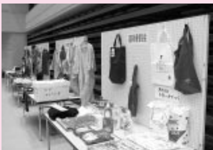
会場の後部には展示スペースを設置

また、会場では管内各協会の活動展示スペースがあり、帽子やバッグ、パッチワーク、リサイクル製品などが展示された。