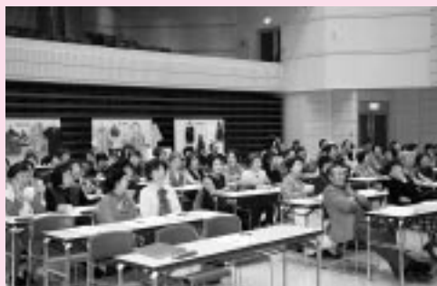
管内から約80名の消費者協会会員が参集