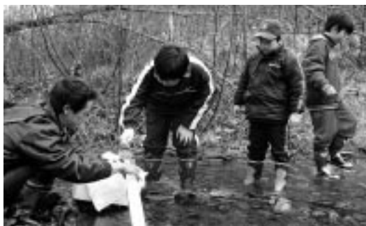
剣道少年団員も放流を手伝った