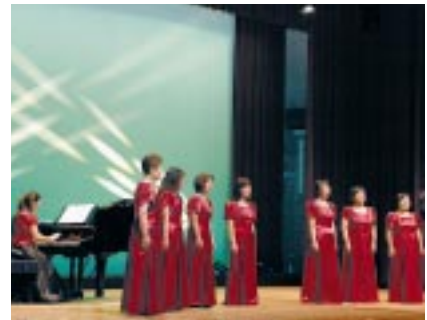
クリスタルコーラス