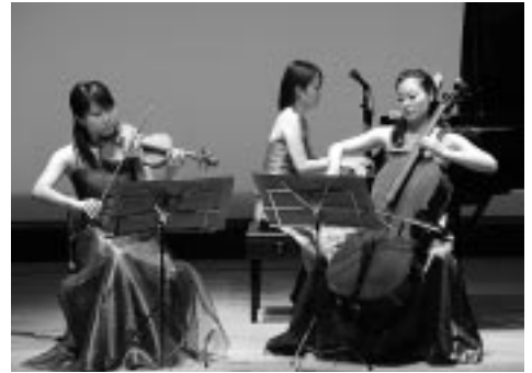
ステキな音色を響かせたコンサート

若手演奏家の3人は、現在、桐朋学園大学(2人)同大学院(1人)に在籍中であるが、リサイタルを開くなど囑望されている。前日の13日には苫小牧小学校で、子どもたちが実際にチェロにさわるなどして、大きさや重さを実感した。また、午後からは古丹別中学校でアウトリーチ活動を行い、児童・生徒にクラシック音楽の魅力を伝えた。