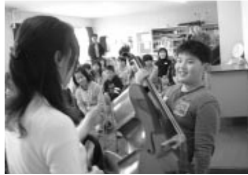
苫小でのアウトリーチ活動の様子