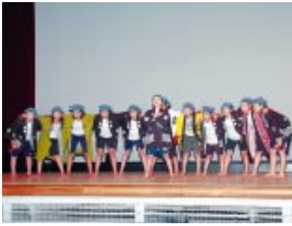
ヨサコイ 苫前小学校5年生