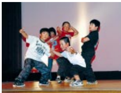
古丹別小学校4年生 ヒップホップダンス