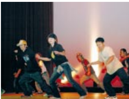
ヒップホップダンス(大人編)