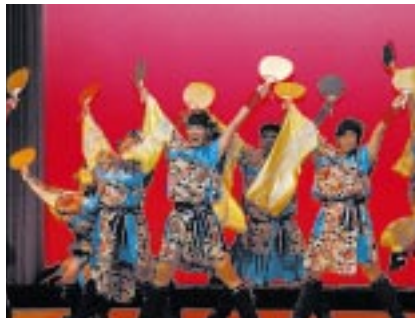
ヨサコイ 苫前鱗萃会