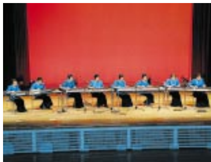
大正琴苫前町同好会