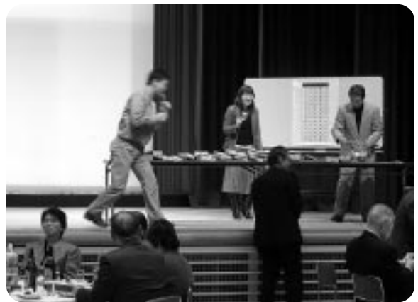
交流会のピンゴゲームの様子