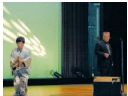
古丹別カラオケ愛好会