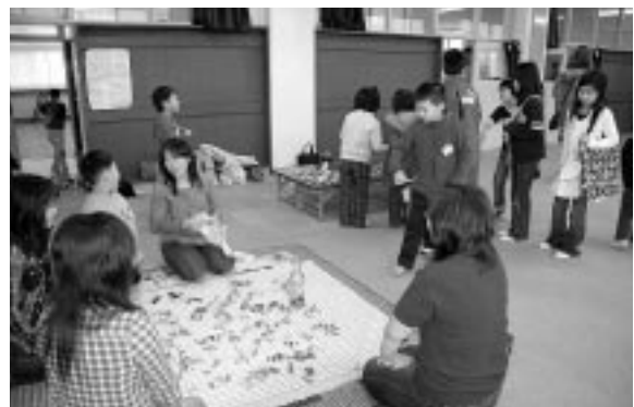
わなげを楽しむ児童と運営に汗する父母

11月12日（日）古丹別小学校で、古小フェスティバルが開催された。午前9時から10時50分までは、子ども達が考えた、ミニフレンドパークやキックターゲット、ストラックアウト、つりゲーム、ダーツゲーム、物当てゲームの出店で賑わった。また、11時からはPTAらが中心となり、フリーマーケット、わなげ、焼き鳥、フライドポテト、たこ焼きなどの出店を運営し、来場した地域の方々や子どもたちと楽しい一日を過ごした。