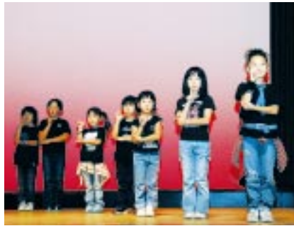
ヒップホップダンス(子ども編)