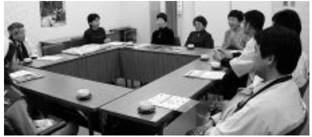
消費者協会員と意見交換