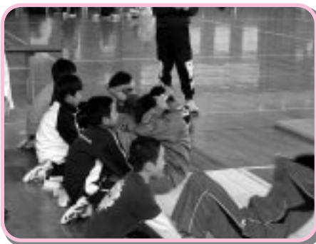
腹筋測定を行う少年団

十一月三日、町民体力テスト会とスポーツの出店が町スポーツセンター及び町営球場を会場に行われた。 これは、「体育の日」（十月九日）に開催する予定であったものが延期になり、文化の日に開催されたもの。 体力テスト会はスポーツ少年団員五十一人、一般四人、六十五歳以上三人が参加した。 少年団員は、体力テストの種目である、時間往復走や腕立て伏せ上体起こしなどに挑戦。終了後は記録集計を行い、一級から五級の合格証が渡された。また、午後からは、ミニバレーやストレッチ、ターゲットボードゴルフなど数多くのスポーツの出店がオープンし、参加者らはさわやかな汗を流していた。