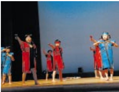
ヨサコイ 古丹別小学校2年生