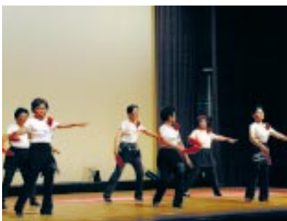
リズム体操サークル