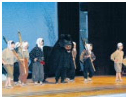
苫前町くま獅子少年団