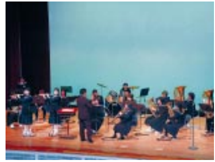
苫中&古中吹奏楽部