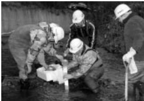
萌州建設社員による環境改善事業

当日は、同社の社員八名が、発眼卵を住みやすくするために、寝床をつくるため、川中を優しく掘り起こし、埋設放流を行った。