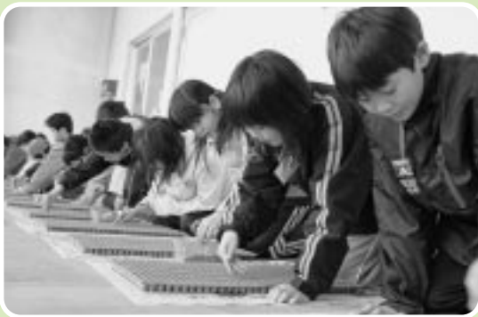
苫前小学校5年生：4月21日種蒔の様子

この他にも、酪農体験や森林教室、地引網体験、環境学習、陶芸体験など数多くの事業が計画されている。