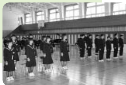
古丹別中学校 (4月6日)