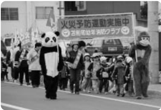
古丹別市街地をパレード行進した 古丹別保育所の子どもたち