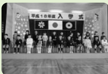
古丹別小学校 (4月6日)