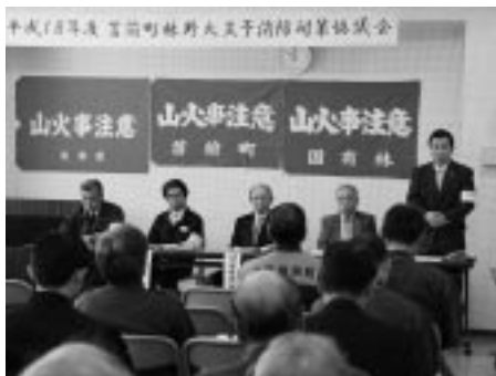
林野火災防止について、あいさつする森町長

北留萌消防組合消防署 苫前支署 6 4 - 2 3 2 1 〃 古丹別支署 6 5 - 4 1 1 9