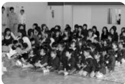
古丹別保育所 (4月3日)