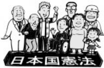
留萌人権擁護委員協議会・苫前町