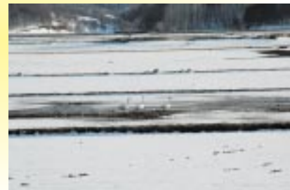
香川の水田に飛来したコハクチョウ

町内の方より「白鳥」がいると情報提供がありました。四月七日午後四時三十分頃、香川三線と四線の間の水田(有)真軌道に白鳥が五羽飛来していた。後で調べたが、特徴から(身長約一・二メートル、翼長約二メートル、くちばしは黒い部分が多い)「コハクチョウ」のようである。また五羽いたことから家族で水田に飛来し、残雪の中に、昨年刈り残った「もみ」のようなもの食べていた。観察から約三十分後に水田を飛び立ち、香川地区から長島地区を旋回しながら、何度か水田に降り立ち、餌を食べていた。 飛ぶときは、ふつと、最初に父親、次に子供、最後に母親が飛び立つとのことである。「人間」も「白鳥」も子どもを守る「親」の姿勢は同じだと思ひ、感動しました。白鳥が北へ向かい、5月号が皆様に届く頃、緑ヶ丘公園にも桜が咲くことになり、今月号より担当することになりましたと泉と申します。よろしくお願致します。