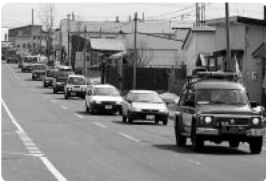
苫前市街地でも危険物安全協会会員 車両などが火災予防の啓発を行った