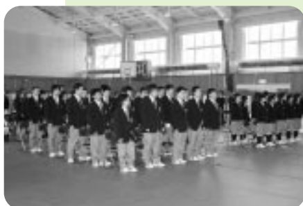
苫前商業高等学校 (4月10日)