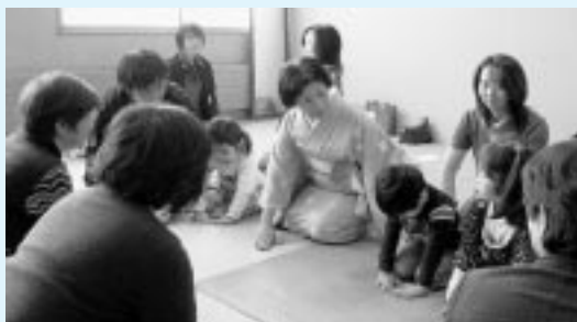
作法を学ぶ幼児たち

また、子どもたちは、講師の様子をじっと見つめ、作法はもとより、見様見まねで一生懸命大人のマネをしていた。一生懸命頑張る姿を講師などに褒められると、恥ずかしそうにしながらも嬉しそうであった。