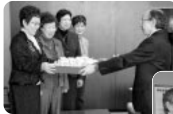
町商工会女性部の皆さんからマスコットの贈呈