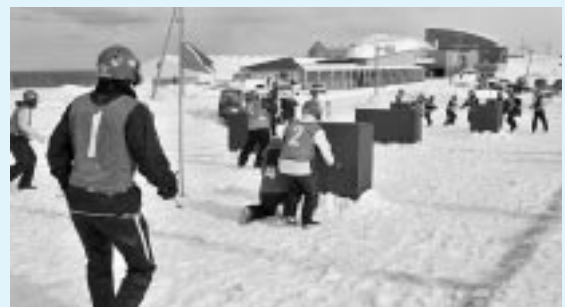
ふわつと前の特設ステージで熱戦が行われた

優勝 留萌クラブ 羽幌ガンバルマンズ 羽幌中野球部 平和歩む最大尊重 古丹別中野球部B 古丹別中野球部A