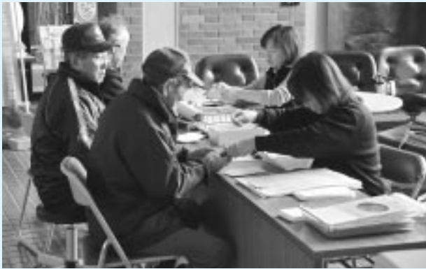
役場ロビーに特設窓口を設置して対応