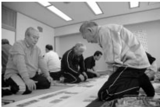
集中力を高める、苫前北斗の金チーム(左側)

A級の優勝は、留萌黒潮。準優勝に苫前北斗の金。一位に初山別北海。B級の優勝は、天塩天龍の竹。準優勝に留萌黒潮の虎、一位に苫前北斗の松が入賞した。