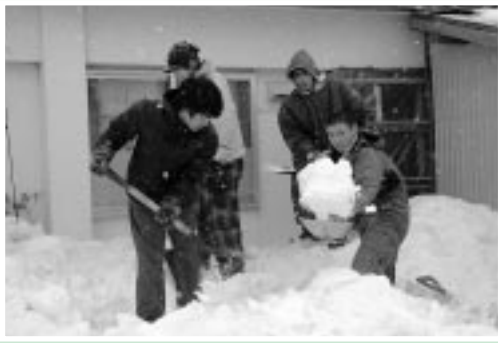
2月8日（金）除雪作業に励む苫商生

社会福祉協議会は「除雪協力団体の意見交換の場を設置することにより、ボランティア意識の高揚と事業の充実を図ることができた。事業終了後には、反省会議も予定している」と意気込む。