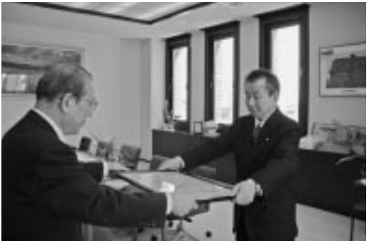
横濱会長から表彰状が手渡された。

また、北海道からは、苫前町のほか、網走管内興部町、十勝管内上士幌町が表彰されている。