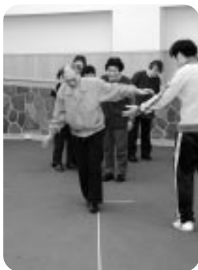
日常動作の体力テストを行う参加者の皆さん