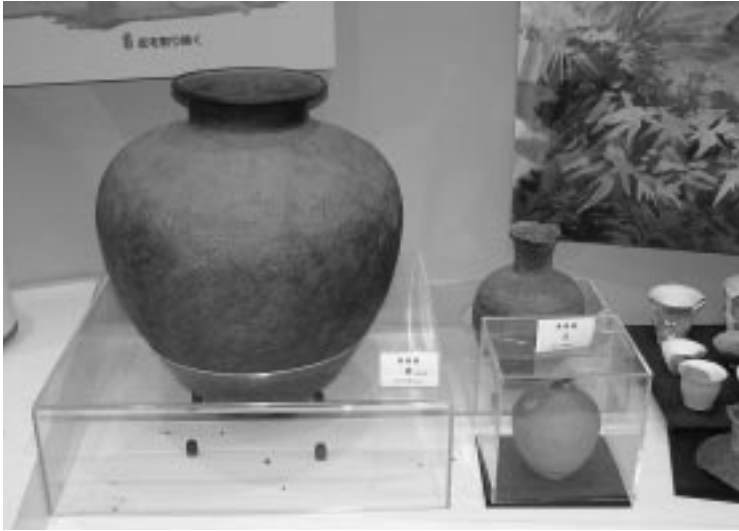
苫前町考古資料館に展示されている完全形状型の大型須恵器

1924年（大正13年）に香川地区で農作業中に発見された須恵器。北海道開拓記念館鑑定の結果、日本最北の完全形状型の須恵器と判明。古丹別川の河口域が交流・交易の拠点であった!?