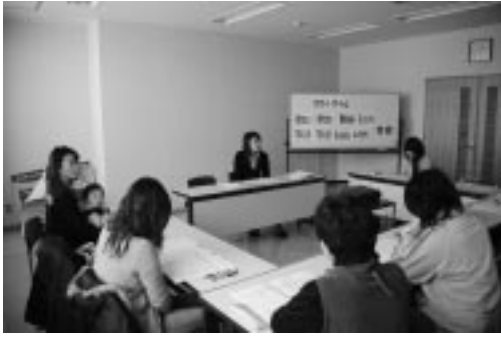
子育て支援体制について学習する受講者の皆さん

一月二十二日(火)午後一時より、町家庭教育推進協議会の第一回目の「子育てサポーター養成講座」が開催された。これは、子育てボランティアを養成し、子育ての支援体制を整備しながら支援者のネットワークづくりを推進することがねらいで、全三回の講座を行う予定である。伊藤通康社会教