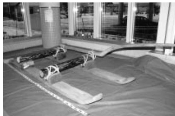
苫前町有形文化財第一号の「修羅」重い原木材等を運搬するために活用した大型のそり