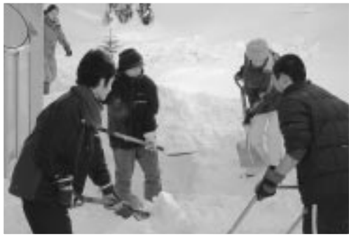
2月2日（土）除雪作業に励む古中生